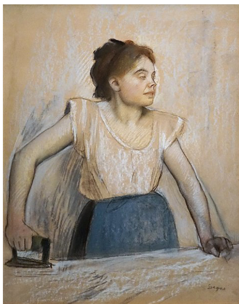
Edgar Degas, La repasseuse , v. 1869, Paris, Musée d'Orsay

Si le travail nous occupe de façon moindre qu'hier, sa centralité dans nos vies demeure, car il structure l'économie et la société. C'est une institution. Le travail occupe une place centrale dans la production (économique) et dans l'organisation de la société (sociologique). Il est politique, car il est source de