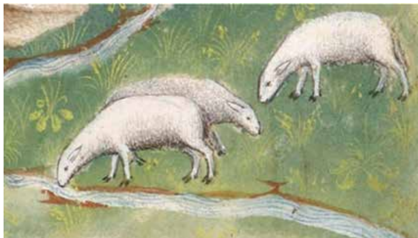
Enluminure extraite du « Livre du chemin de long estude » de Christine de Pisan, 1400-1410

La privatisation des terrains a eu un effet économique positif, dans la mesure où elle a conduit un accroissement de la productivité des sols. Les clôtures ont aussi favorisé l'élevage, des moutons en particulier, ce qui a conduit certains paysans à développer un nouveau travail en filant la laine à domicile. Mais le mouvement des enclosures a aussi provoqué d'immenses ravages sociaux, vidant et détruisant des villages entiers, transformant les habitants « d'honnêtes laboureurs qu'ils étaient en une tourbe de mendiants et de voleurs », comme l'écrit encore Polanyi 2 .