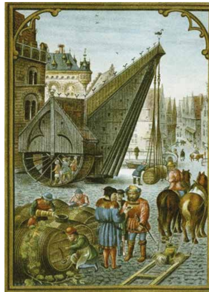
Marché du vin à Bruges, vers 1530. Peinture sur papier de Simon Bening

Les risques sont considérables : certains navires disparaissent corps et bien, et tout l'argent investi par les armateurs est alors perdu. Mais quand les expéditions réussissent, ce qui n'est pas rare car, au fil du temps, la navigation est rendue toujours plus sûre par les avancées techniques et scientifiques, quand les bateaux rentrent dans leur port d'attache, à Londres, Hambourg, Amsterdam, Anvers, Nantes, Bordeaux ou Lisbonne, alors c'est la promesse d'un gain qui dépasse de loin ce que peuvent rapporter tous les autres investissements. C'est cette perspective de profit exceptionnel qui justifie qu'on finance ces très coûteuses expéditions par des systèmes boursiers qui permettent aux marchands de partager les risques. C'est ce processus qui va faire de ces marchands une classe de plus en plus puissante. C'est ce qui va amener ces villes portuaires à poser les jalons d'un marché de plus en plus unifié.