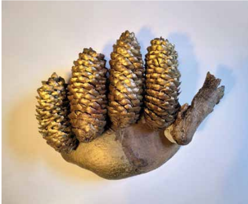
Carmelo Virone, La main squameuse (cauchemar d'Adam Smith) , 2020.