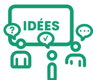
Ateliers d'innovation participative

L'Atelier RUSCH est une agence hybride composée de designers, d'urbanistes, de cartographes et d'économistes. Inspiré des techniques d'innovations sociales des pays nordiques et des méthodes du design, l'Atelier RUSCH « se donne pour mission de véhiculer et d'expérimenter des méthodes créatives d'organisation de l'intelligence collective de manière transversale et participative ». Avec ces méthodes, l'équipe de l'Atelier veille « à ce que les usagers se réapproprient des lieux, des thématiques, des projets par le FAIRE avec comme levier principal : l'expérience utilisateur/usagers. » 2