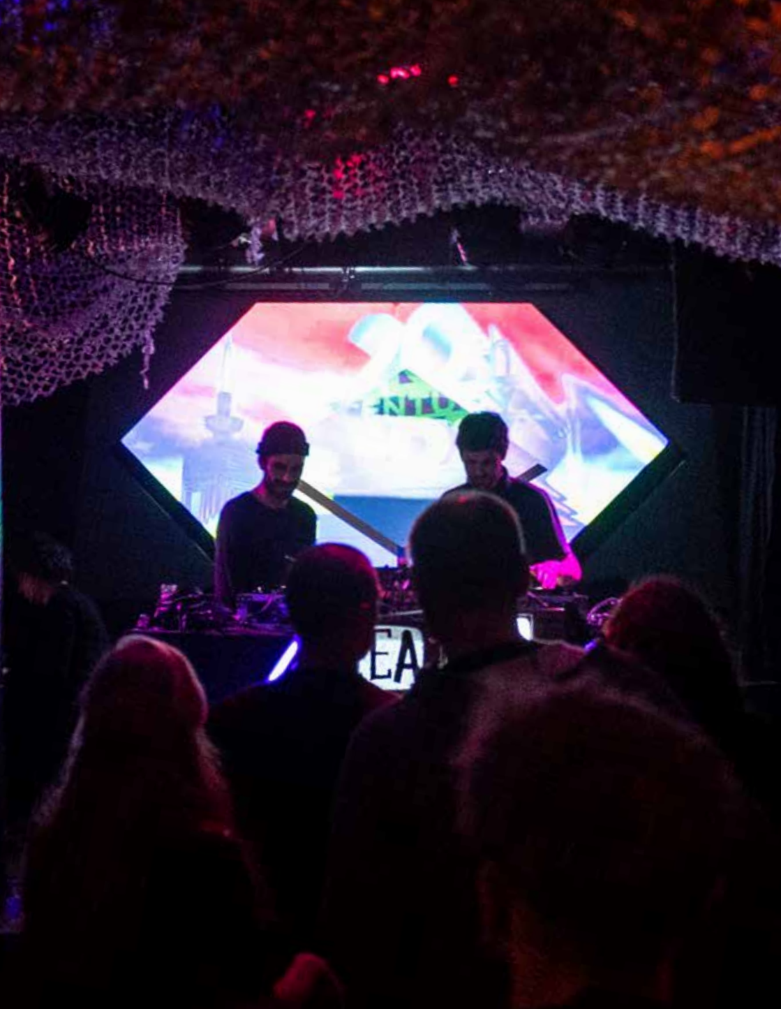
Concert au KulturA (Liège).