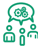
Conduite de projets collaboratifs

L'Atelier Rusch est résident à ICI Montreuil, la première manufacture collaborative du réseau Make ICI. Celle-ci regroupe des ateliers d'entrepreneurs de la création, d'artisans et d'artistes. Cet écosystème favorise la créativité, l'innovation et la solidarité. Les compétences de designers, architectes, menuisier, urbanistes, sociologues, graphistes, vidéastes et créateurs en tout genre sont donc mutualisées pour concevoir de nouveaux projets et développer des activités. Les ateliers d'ICI Montreuil mettent à disposition des machines et des outils pour travailler le bois, le métal, le textile, l'électronique, le plastique... Grâce à cet écosystème qui s'étend aujourd'hui à Marseille et bientôt à Nantes, Paris et dans le Morvan, ils peuvent prototyper, concevoir et fabriquer tous les concepts possibles et imaginables !