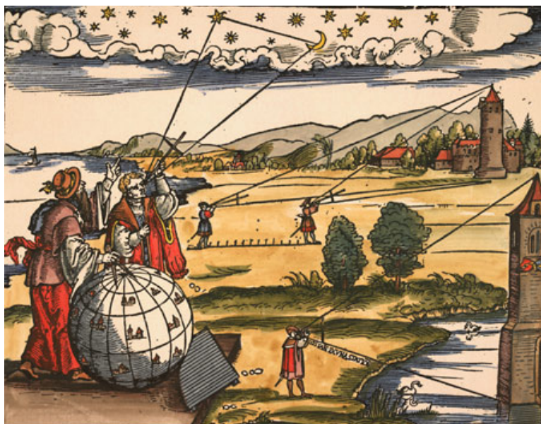
Le bâton de Jacob, utilisé en astronomie (au premier plan) et pour l'arpentage. Gravure extraite de l'Introductio geographica de Petrus Apianus, 1532.