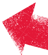
Table des revendications